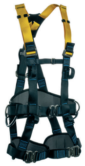
AT 7031 LE - A3A aplicação: Trabalho em altura, na retenção de queda, posicionamento e suspensão/ sustentação. - CA 36.399