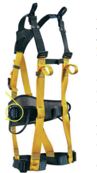
RUST AT 7015 ATHOS CONFORT II aplicação: Trabalho em altura na retenção de queda e posicionamento e suspensão. (espaço confinado) Argolas e fivelas com tratamento anti-oxidação. - CA 37.977