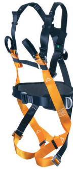
AT 7030 EL aplicação: Trabalho em altura na retenção de queda, posicionamento e suspensão (espaço confinado). - CA 36.373