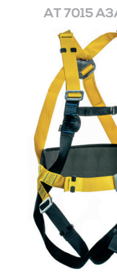
AT 7015 A3A II