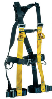
AT 7015 ATHOS II aplicação: Trabalho em altura na retenção de queda. - CA 37.975