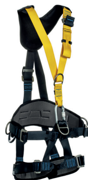
RUST AT 7033 KTL PRO aplicação: Trabalho em altura, na retenção de queda, posicionamento e suspensão/ sustentação. Argolas e fivelas com tratamento anti-oxidação. - CA 36.374