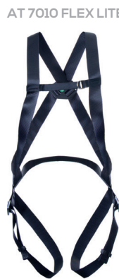
AT 7010 FLEX LITE