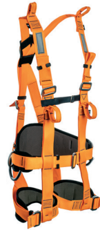
AT 7030 EL V aplicação: Trabalho em altura na retenção de queda, posicionamento e suspensão (espaço confinado). - CA 39.539