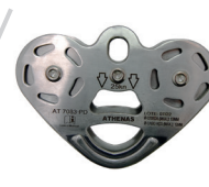
AT 7083 PD