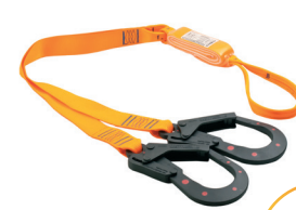
AT 707 YFE ABS-DE aplicação: Retenção de queda, progressão vertical.