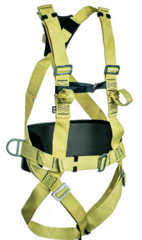
AT 7015 ATHOS CONFORT ARAMIDA aplicação: Trabalho em altura, na retenção de queda, posicionamento. - CA 37.976