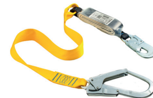
AT FT ABS [707] aplicação: Retenção de queda.