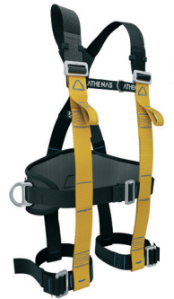
AT 7015 ATHOS CONFORT II aplicação: Trabalho em altura na retenção de queda e posicionamento. - CA 37.977