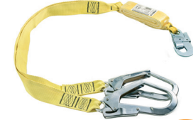
AT 707 CY ARAMIDA ABS aplicação: Retenção de queda, progressão vertical.