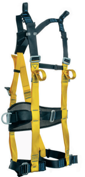
AT 7015 ATHOS CONFORT II PLUS aplicação: Trabalho em altura na retenção de queda e posicionamento e suspensão. (espaço confinado) - CA 37.977