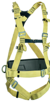
AT 7015 ATHOS CONFORT ARAMIDA II aplicação: Trabalho em altura na retenção de queda, posicionamento e suspensão. (espaço confinado) - CA 37.976