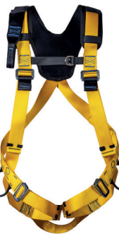
AT 7010 AGIOS aplicação: Trabalho em altura na retenção de queda - CA 37.978