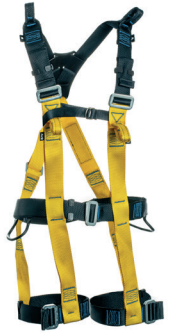
AT 7015 ATHOS III aplicação: Trabalho em altura na retenção de queda e suspensão. (espaço confinado) - CA 37.975