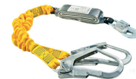
AT YFE ABS [110] aplicação: Retenção de queda, progressão vertical.