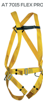
AT 7015 FLEX PRO