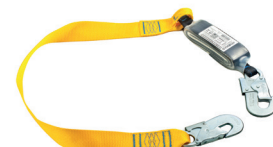
AT FT ABS [701] aplicação: Retenção de queda.