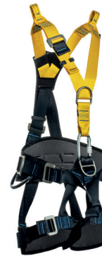
AT 7033 GRE aplicação: Trabalho em altura, na retenção de queda, posicionamento e suspensão/ sustentação. (espaço confinado) INOX - CA 36.374