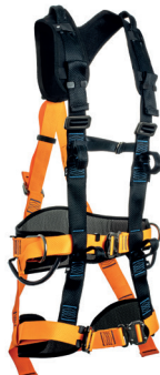
AT 7030 NCE aplicação: Trabalho em altura, na retenção de queda, posicionamento e suspensão/ sustentação. (espaço confinado) - CA 36.399