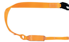
AT FT ABS D [701] aplicação: Retenção de queda.