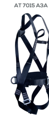
AT 7015 A3A I