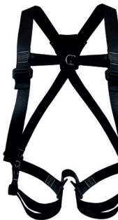
RUST AT 7010 AGIOS aplicação: Trabalho em altura na retenção de queda. Argolas e fivelas com tratamento anti-oxidação. - CA 37.978