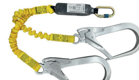
AT YFE ABS [110] aplicação: Retenção de queda, progressão vertical.