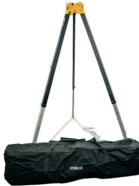
AT 9003 TEC