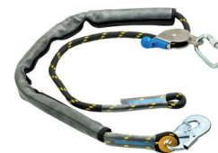
AT 700 AJ MN aplicação: Posicionamento e limitação de atividades em altura.