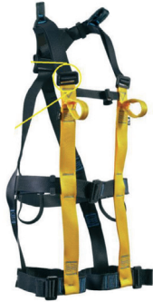
RUST AT 7015 - ATHOS III aplicação: Trabalho em altura na retenção de queda e suspensão. (espaço confinado) Argolas e fivelas com tratamento anti-oxidação. - CA 37.975