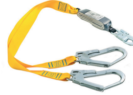
AT YFT ABS [707] aplicação: Retenção de queda, progressão vertical.