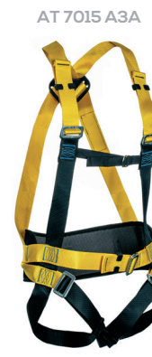
AT 7015 A3A