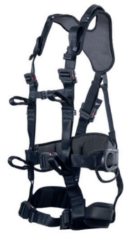
AT 7030 NCE-DE aplicação: Trabalho em altura na retenção de queda, posicionamento e suspensão. (espaço confinado) - CA 36.399