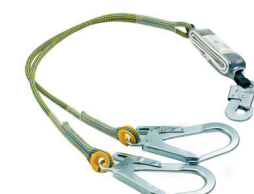
AT 707 Y CAP ABS aplicação: Retenção de queda, progressão vertical.