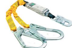
AT YFE ABS FALL FACTOR [707] aplicação: Retenção de queda, progressão vertical.