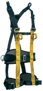
AT 7015 ATHOS CONFORT ARAMIDA II aplicação: Trabalho em altura na retenção de queda, posicionamento e suspensão. (espaço confinado) - CA 37.977