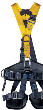
AT 7033 GRE AC aplicação: Trabalho em altura, na retenção de queda, posicionamento e suspensão/ sustentação. - CA 39.538